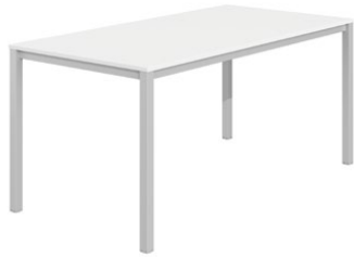
Σταθερό ύψος / Fixed height